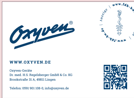
Beispiel Anzeige 1/2 Seite quer, Standplan