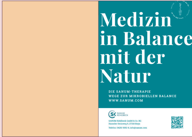
Beispiel Anzeige 1/1 Seite Broschüre/Standplan, rechts