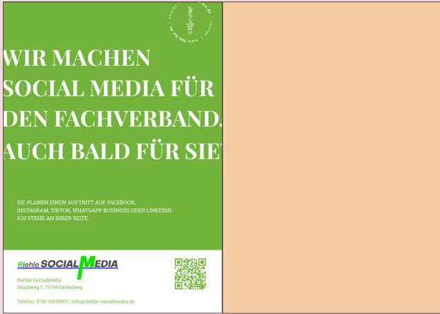
Beispiel Anzeige 1/1 Seite Broschüre/Standplan, links